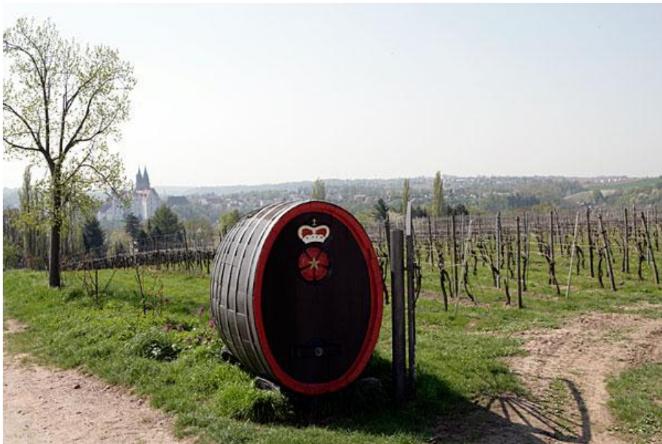
De wijngaard Proschwitzer Katzensprung, op 200 m van de Elbe en 200 m hoogte

De gunstige ligging van de wijngaarden op het zuiden, het microklimaat aan de Elbe en de ideale bodemcombinatie van löss-leem op rode granietrotsen zijn de grote troeven van Weingut Schloss Proschwitz. Door de 6 meter dikke laag löss-leem ontstaan wijnen met veel fruit, terwijl het graniet de wijnen lengte en kracht bezorgt. Deze bodem is minder geschikt voor riesling, maar des te meer voor pinot rassen, in Duitsland Burgundersorten genoemd. De wijngaarden bevinden zich op hellingen, die variëren van 10 tot 25%. Ze bieden uitzicht op het pittoreske stadje Meissen, waar zich de beroemde porseleinfabriek bevindt.